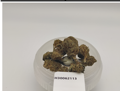
Foto del campione

Grado di umidità al momento dell'analisi - 9.52%